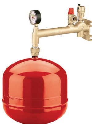
Ekspansjonstank med oppheng og sikkerhetsventil