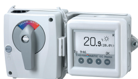
EC Home shuntautomatikk